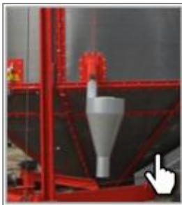
Принудительный очиститель от пыли и отходов с циклоном