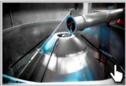
Центральный шнек из стали Hardox