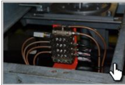
Централизованная система смазки