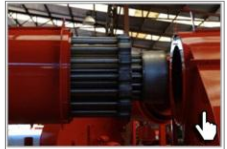
Топочный блок из трех видов легированной стали