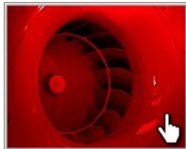
Бесшумный центробежный вентилятор