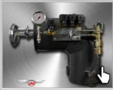
Модульная горелка Pedrotti (дизель/печное топливо)