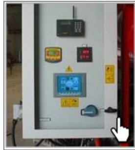
Сенсорная панель управления