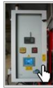
Интеллектуальная система управления