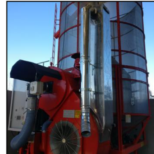
Система рекуперации тепла