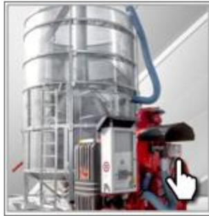
Двойная гальванизированная рама