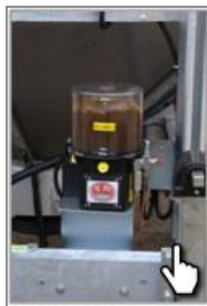
Автоматическая смазка узлов