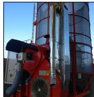
Система рекуперации тепла