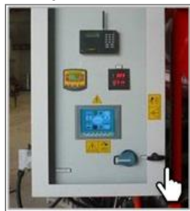
Сенсорная панель управления