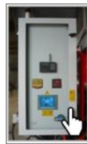
Интеллектуальная система управления