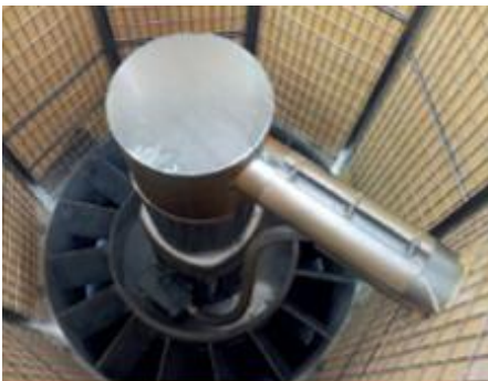
Бесшумные вытяжные вентиляторы

Герметичная колонна полностью исключает просыпание зерна