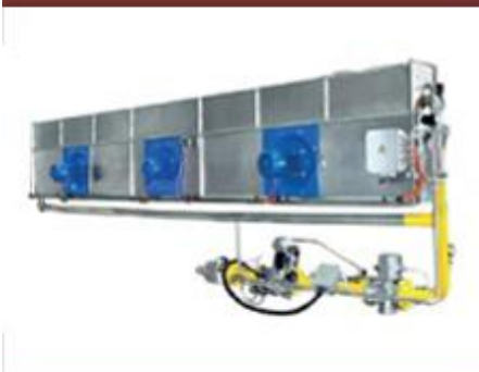
Линейная горелка Tesflam №1 в Европе