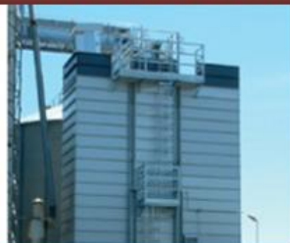
Наружные и внутренние лестни- цы в базовой комплектации