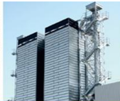
Полностью теплоизо- лированная шахта