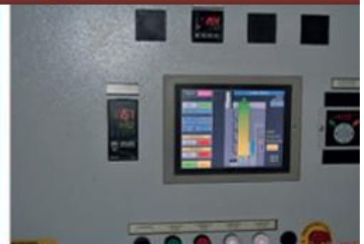
Пульт управления с ПО на русском языке