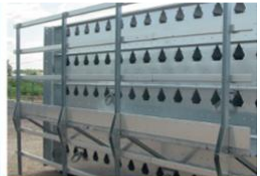
Панели из Aluzink – на 200% большая стойкость к коррозии