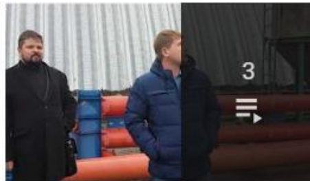
Интервью о работе техники