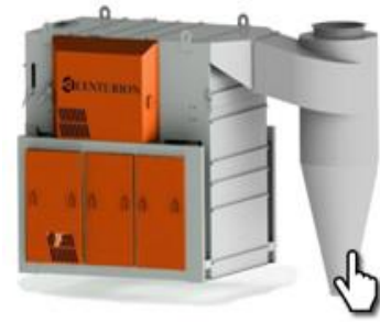
Универсальный сепаратор Centurion US60