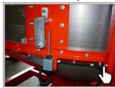
Многоуровневая система безопасности