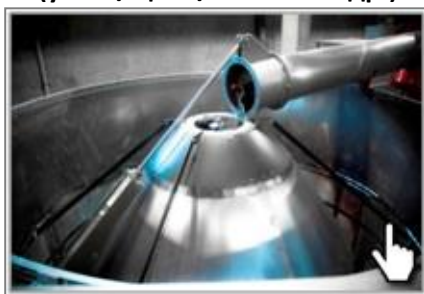
Центральный шнек из стали Hardox