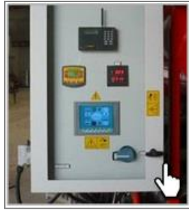
Сенсорная панель управления