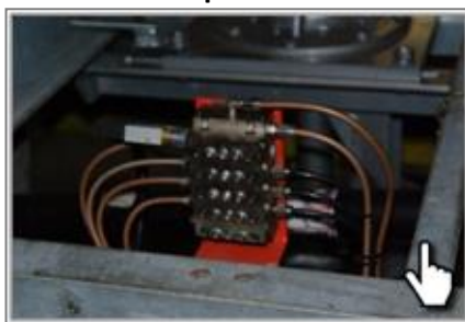
Централизованная система смазки