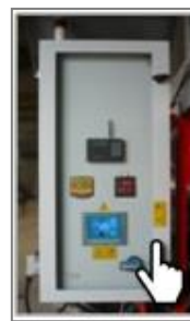
Интеллектуальная система управления