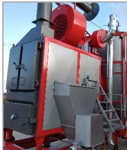
Твердотопливный блок Pedrotti (уголь/щепа/пеллеты и др.)