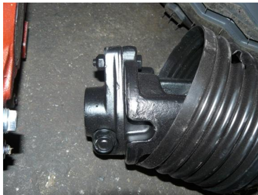
Муфта со срезным штифтом