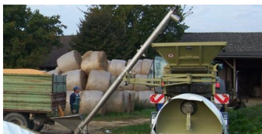
Рабочее положение приемного шнекового конвейера