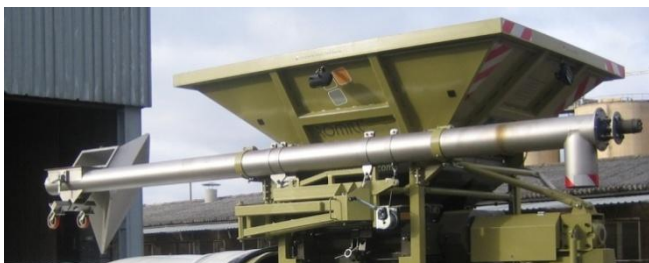
Транспортное положение приемного шнекового конвейера

Шнековый конвейер снабжен механизмом складывания, транспортируется по дорогам общего пользования непосредственно на плющилке. Переход из транспортного положения в рабочее и обратно производится очень легко и быстро.