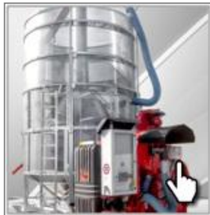
Двойная гальванизированная рама