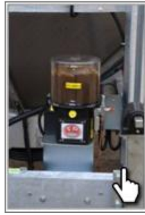
Автоматическая смазка узлов