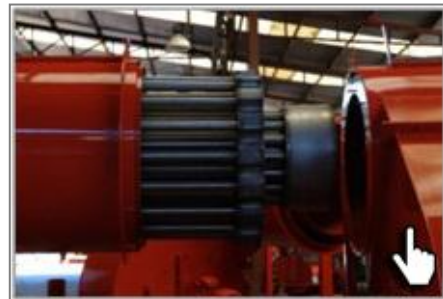
Топочный блок из трех видов легированной стали