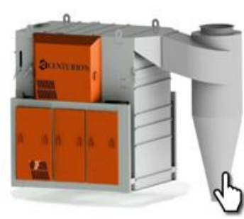
Универсальный сепаратор Centurion US60