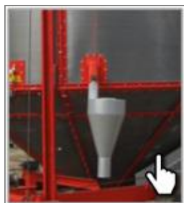
Принудительный очиститель от пыли и отходов с циклоном