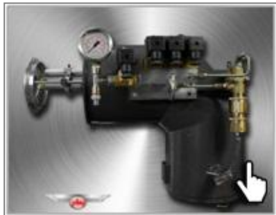
Модульная горелка Pedrotti (дизель/печное топливо)